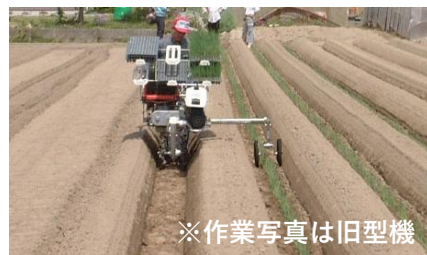
※作業写真は旧型機