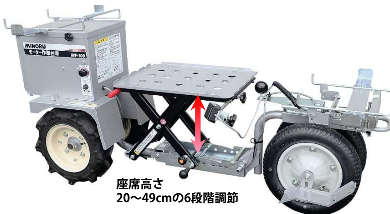
座席高さ 20～49cmの6段階調節