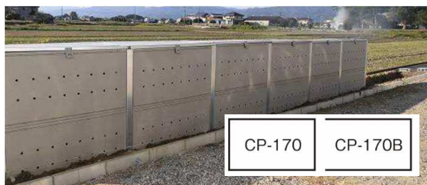
※連結設置専用のCP-170Bを使用。CP-170B単体では使用できません。

型式：CP-170 容量：約1,700L 寸法：幅1.5m×奥行0.75m×高さ1.5m