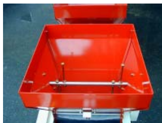
◇第1床土ホッパーの攪拌装置。