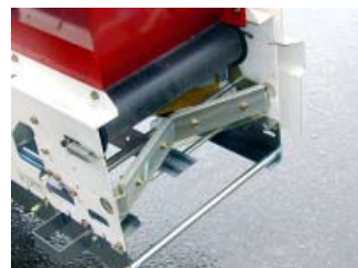
◇覆土マス切り装置。