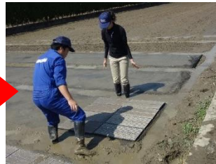
手作業で苗箱を8枚ほど並べ、 その上に本機を置きます。