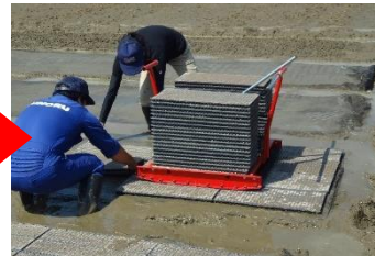
本機へは苗箱が最大40枚積めます。 苗箱並べと運搬を 繰り返しながら進みます。