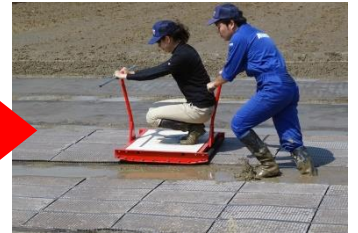
最後に、本機へ50~70kgの 重量をかけて苗箱を 鎮圧していきます。