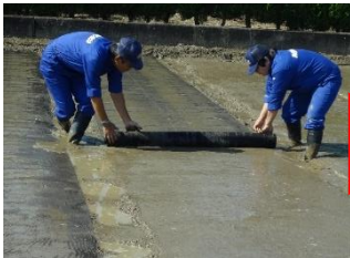
従来通り、苗床を作って 根切りネットを敷きます。