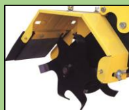
爪10AY (耕耘幅:100mm) EU-52標準爪