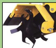
爪15AY (耕耘幅:150mm) EU-52S標準爪