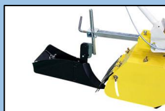
ネギ培土板AY (培土幅:10~18cm)