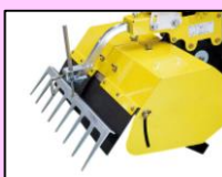
広幅爪AY [レーキ、抵抗棒取付ステー低、広幅車輪(左・右)、 広幅爪(左・右)/耕耘幅:48cm、広幅爪カバー外]