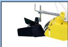
ブロッコリー培土板AY (培土幅:20~32cm)