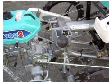
▲機体高さの調節もラクラク