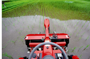
運転席からの視点