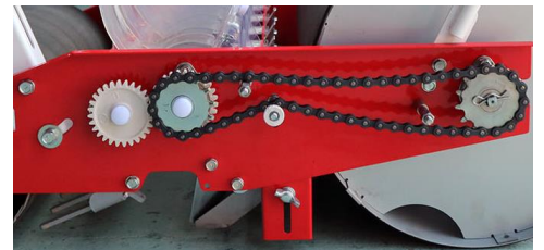
スプロケットと替えギヤーの交換で株間の変更を行います