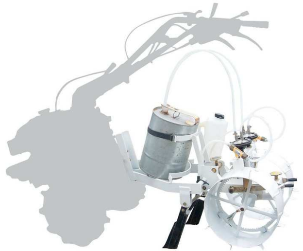
千鳥点注式 2条タイプ