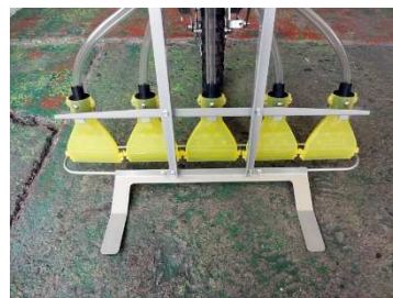
散布幅75cm (オプションの止栓で45cm)