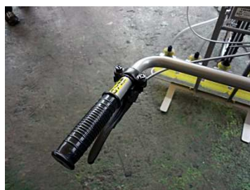
散布は手元レバーで「入」「切」