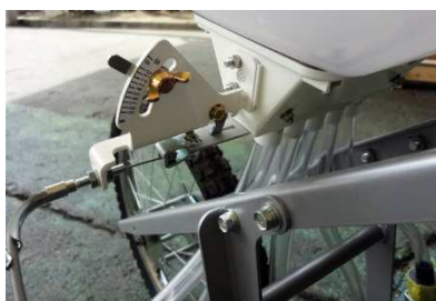
散布量は、開度の設定で調節可能